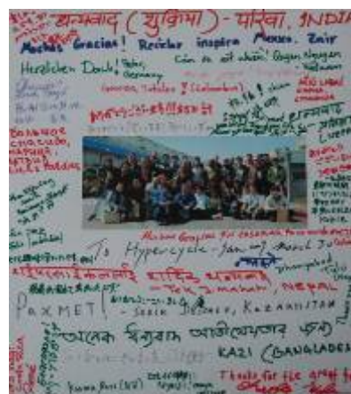
家電リサイクル工場の方たちに感謝を込めて、20カ国語以上の言語で「ありがとう」が書かれた色紙。「このような色紙は前代未聞です!」と、担当者の方も感激。