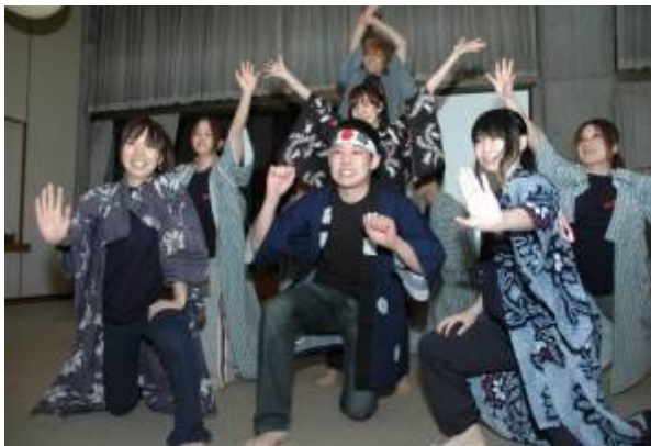
毎晩、秘密で特訓してきたソーラン節を披露する日本人参加者