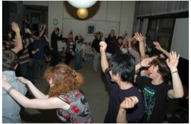
カルチュラルナイトのあとは、恒例の国際パーティ。最後はみんなで片付けます。