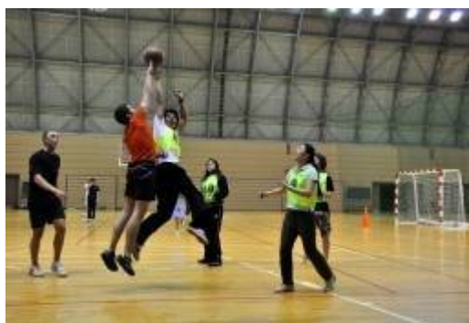
夕方のフリータイムには、スポーツ