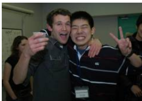
お酒を片手に、国際交流

押入の使い方を間違える外国人参加者。この後、ふすまを壊して、ファシリテーターにこっぴどくしかられる羽目に・・・。