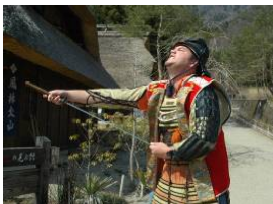
侍のコスチュームに着替え、セップクの真似をするコスタリカからの参加者。日本の文化に興味津々。