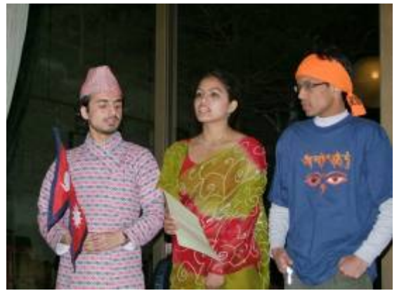
伝統的なコスチュームを着て、自国の紹介をする海外からの参加者。左は、日本人とメキシコ人によるメキシカンダンス。