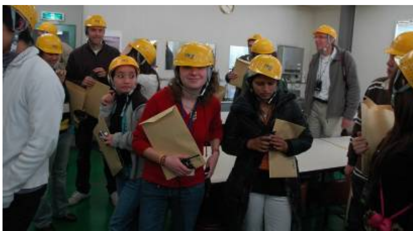
家電リサイクル工場見学の一幕。ハイテクな設備に、参加者は大感激。一方、工場の担当者の方々は、元気にはしゃいで質問ばかりする YES グループに驚きを隠しきれない様子。

プログラム期間中、バスを借り切って、環境関連施設を見学に行きます。2009年には、ハイパーサイクル（家電リサイクル施設）、中央防波堤（東京湾の廃棄物の埋立地）、生物多様性センター（富士吉田市）などを見学しました。この他にも、浅草、東京都庁、富士山のみもとでハイキングなど、日本の観光名所も訪問します。外国からの参加者にとっては、道中、珍しいことばかり。「どうして日本では燃えないゴミと燃えるゴミに分けるの?」「おみくじって何?」「異様に日焼けした、あの女子高生は外国人なの?」などなど、質問攻めにあります。私たち日本人にとっては、当たり前なことでも、日本に初めて来た外国人にとっては、そうではありません。彼らが納得するような説明を・・・と試行錯誤するうち、自分の国「日本」について意識的に考えるようになります。