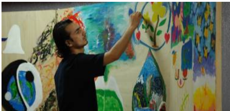
油絵に取り組むネパールからの参加者。表情は真剣そのもの。20カ国以上の「サステナビリティ」が一枚の板の上に表現されます。（この油絵の完成版は本報告書の表紙に掲載されています。）