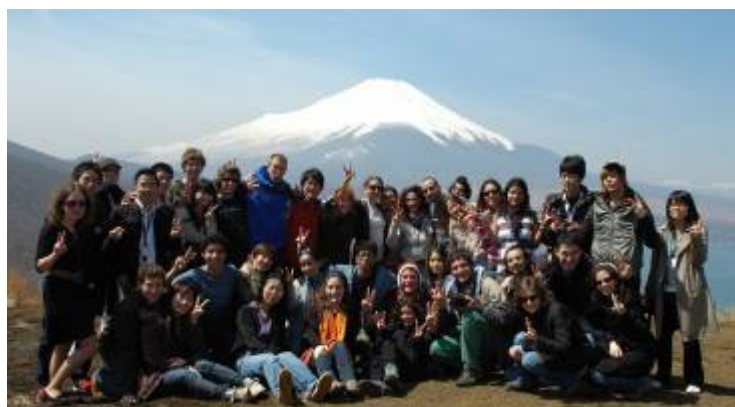
ハイキングの途中で記念撮影。綺麗に見える富士山に一同感激!